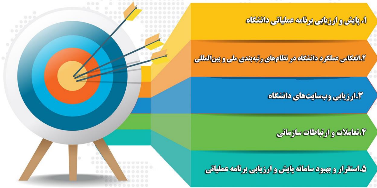
مرکز ارزیابی و پایش عملکرد دانشگاه الزهراء (س)