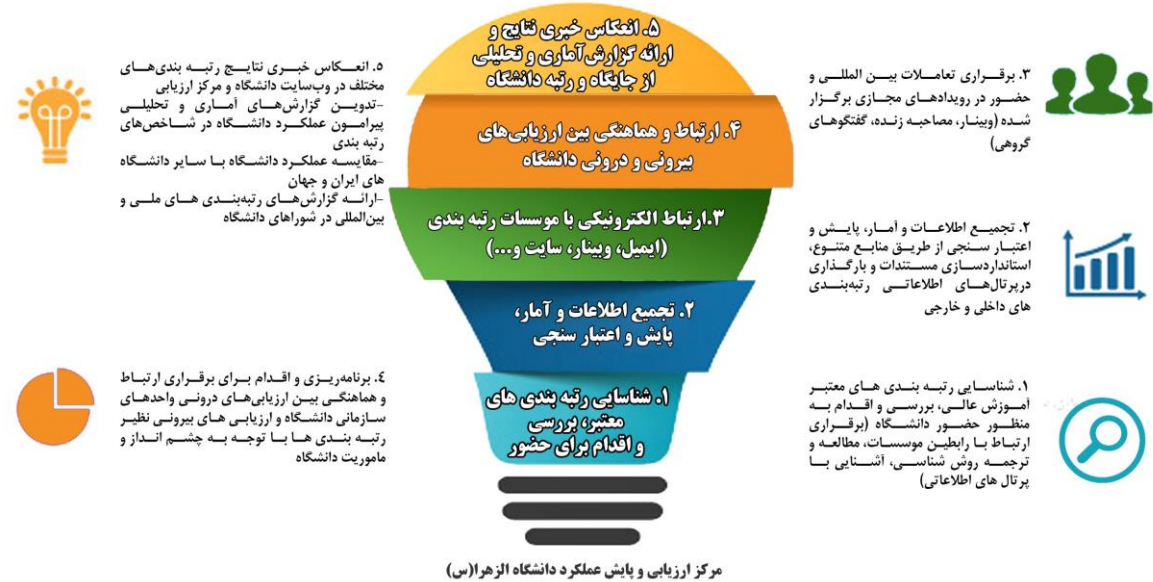
مرکز ارزیابی و پایش عملکرد دانشگاه الزهراء (س)