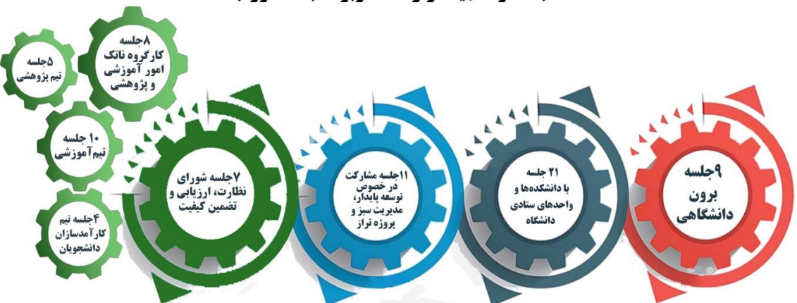
مرکز ارزیابی و پایش عملکرد دانشگاه الزهراء (س)

برگزاری ۷۵ جلسه درون و برون دانشگاهی به همراه تهیه گزارشات مربوط به دستور جلسات