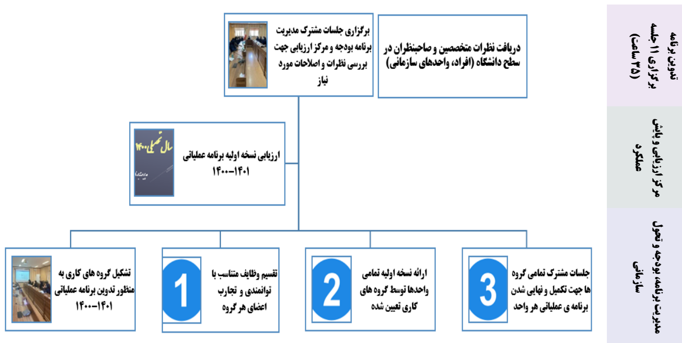
تدوین برنامه عملیاتی دانشگاه الزهراء(س) (۱۴۰۰-۱۴۰۱) - کارگروه مشترک مدیریت برنامه، بودجه و مرکز ارزیابی