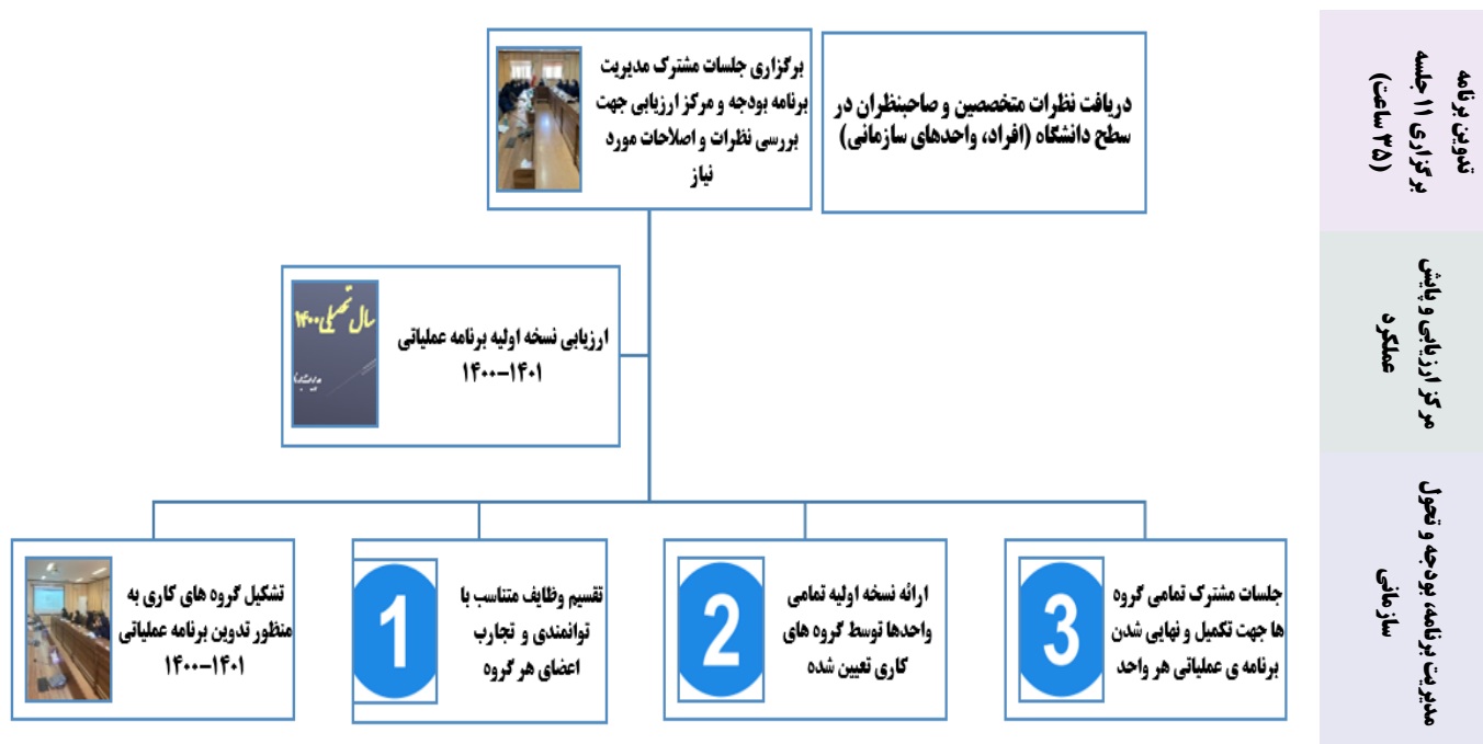
تدوین برنامه عملیاتی دانشگاه الزهراء(س) (۱۴۰۰-۱۴۰۱) - کارگروه مشترک مدیریت برنامه، بودجه و مرکز ارزیابی