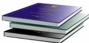
شکل ۱-۱ شرح شکل

به‌عنوان نمونه شکل (۱-۱) در زیر ارائه شده است.