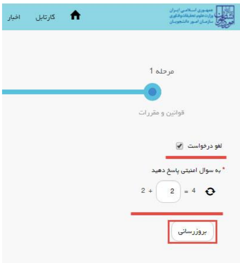
تصویر ۱۲- لغو درخواست

همچنین می توانید با انتخاب گزینه لغو درخواست نسبت به لغو فرآیند اقدام نمایید.(تصویر ۱۲)