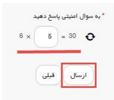
تصویر ۵- سوال امنیتی

سپس به سوال امنیتی پاسخ داده و بر روی دکمه ارسال کلیک کنید. (تصویر ۵)