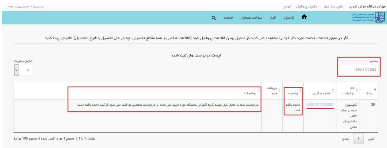
تصویر ۱۳-عدم تایید درخواست

۲. در صورتی که کارشناس آموزشی دانشگاه (در مرحله بررسی اولیه درخواست و مدارک متقاضی) اعلام عدم تایید درخواست نماید.(تصویر ۱۳)