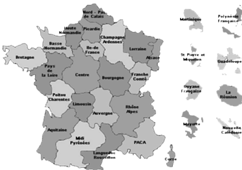
Fig. 3- Carte des vingt-deux régions actuelles, héritage des années 1960

administrative des services déconcentrés de l'Etat. Les régions administratives françaises sont en 2014 au nombre de 27 : 22 régions de France métropolitaine (y compris la collectivité territoriale de Corse, qui n'a pas la dénomination de « région » mais en exerce les compétences) et cinq départements et régions d'outre-mer (la collectivité de Mayotte ne comprenant pas de conseil régional à la différence des quatre autres collectivités d'outre-mer, mais seulement une assemblée délibérante unique tenant lieu de conseil général et conseil régional).