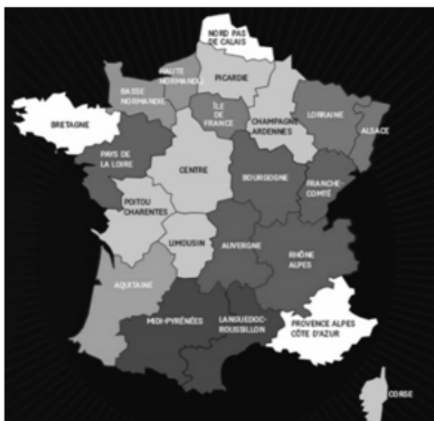
Fig. 5- Carte de futures 14 régions, redécoupées par François Hollande, le 3 juin 2014