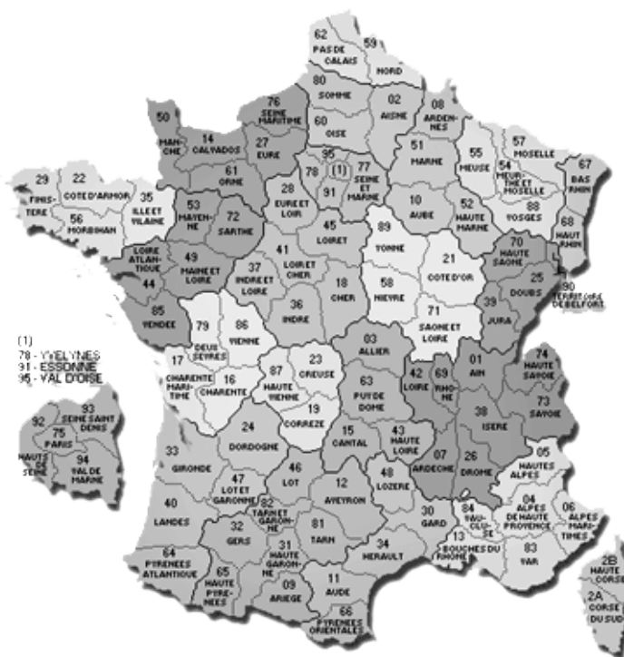
Fig. 2- Carte de départements français métropolitains

Actuellement ils sont au nombre de 101, dont 96 en métropole. La loi du 17 mai 2013 relative à l'élection des conseillers départementaux, des conseillers municipaux et des conseillers communautaires et modifiant le code électoral prévoit qu'à compter de leur prochain renouvellement général prévu en mars 2015, les conseils généraux, qui sont les assemblées délibérantes départementales, prendront la dénomination de conseils départementaux. Les électeurs de chaque canton éliront deux membres de sexe différent se présentant en binôme de candidats. Les conseils départementaux se renouvelleront intégralement tous les six ans.