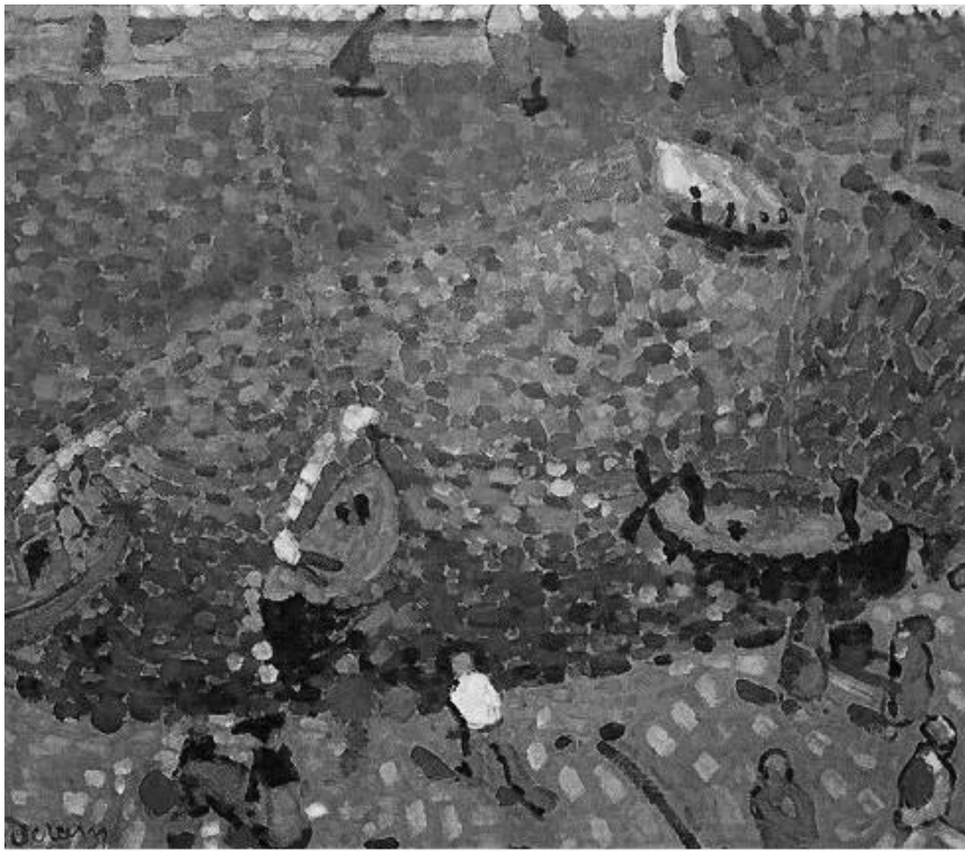
Bateaux à Collioure, 1905, André Derain, Collection privée.

Un buste placé au centre de la pièce fait alors écrire à Louis Vauxcelles : « C'est Donatello parmi les fauves ». La formule plaît tellement que la salle est bientôt rebaptisée « la cage aux fauves ». Par extension, les artistes y ayant exposé sont assimilés à cette expression et leur peinture est qualifiée de « fauviste ».