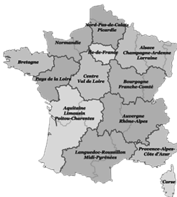
Fig. 6- Carte de 13 nouvelles régions françaises