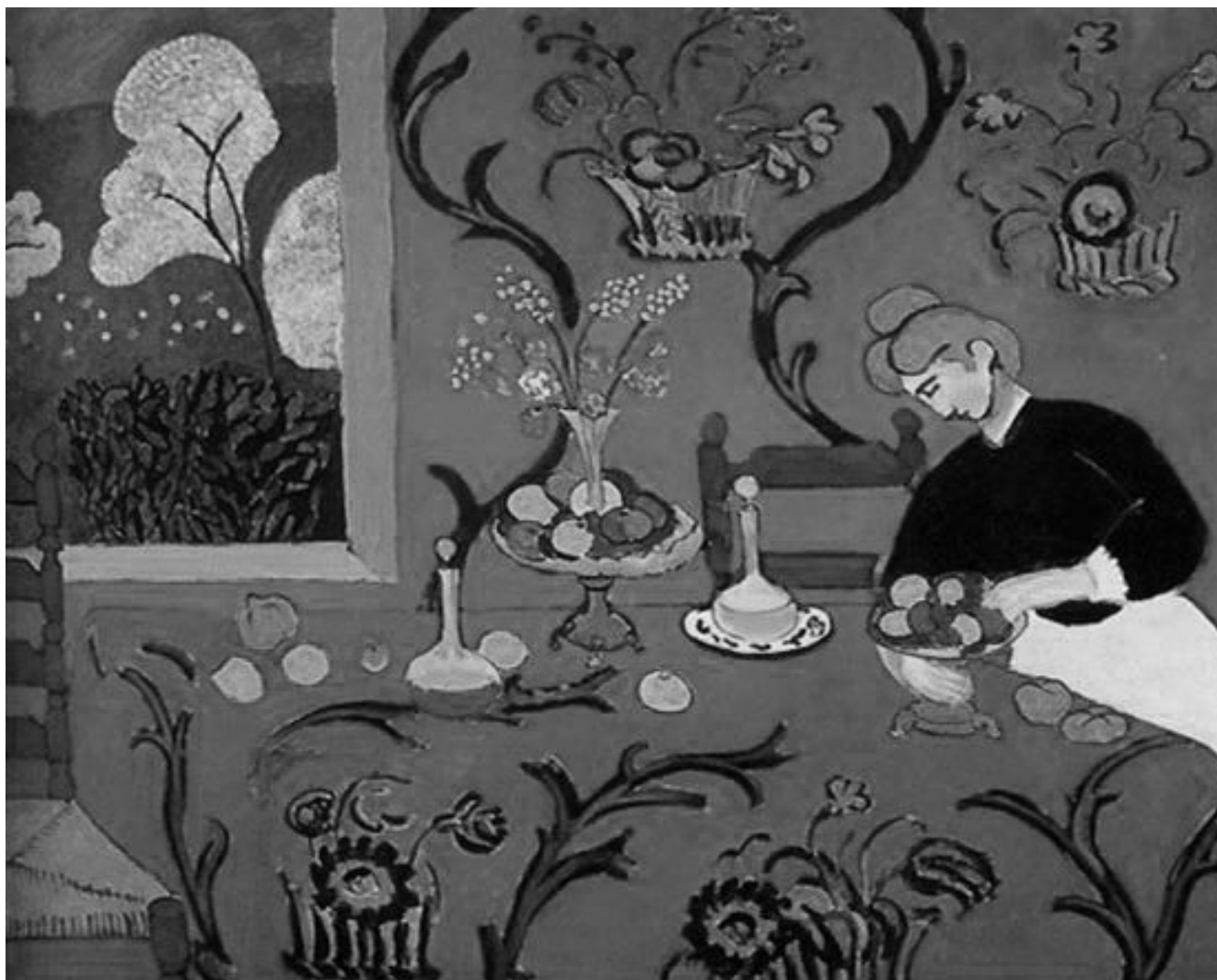
La grande desserte rouge, 1908, Henri Matisse, Saint Petersburg, Musée de l'Hermitage

de la couleur. Dès 1899, les couleurs annoncent sa période fauve, mais il est également marqué par la peinture de Cézanne qui inspire sa peinture jusqu'en 1903. En 1904 il devient à une touche divisionnisme proche de Signac et exalte ses couleurs.