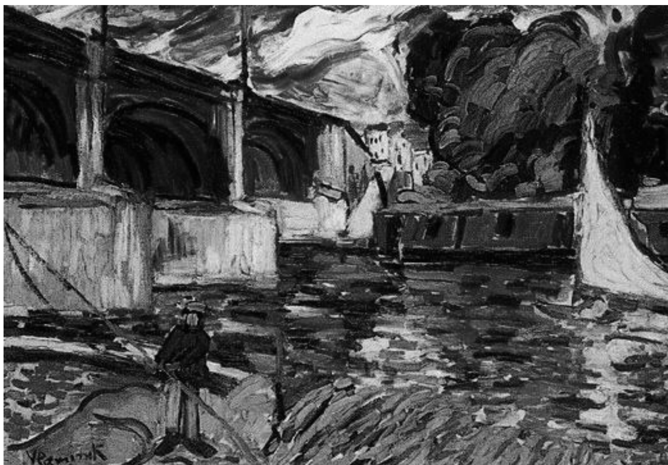
Le Pont de Chatou, 1906-1907, Maurice de Vlaminck, Berlin, Nationalgalerie.