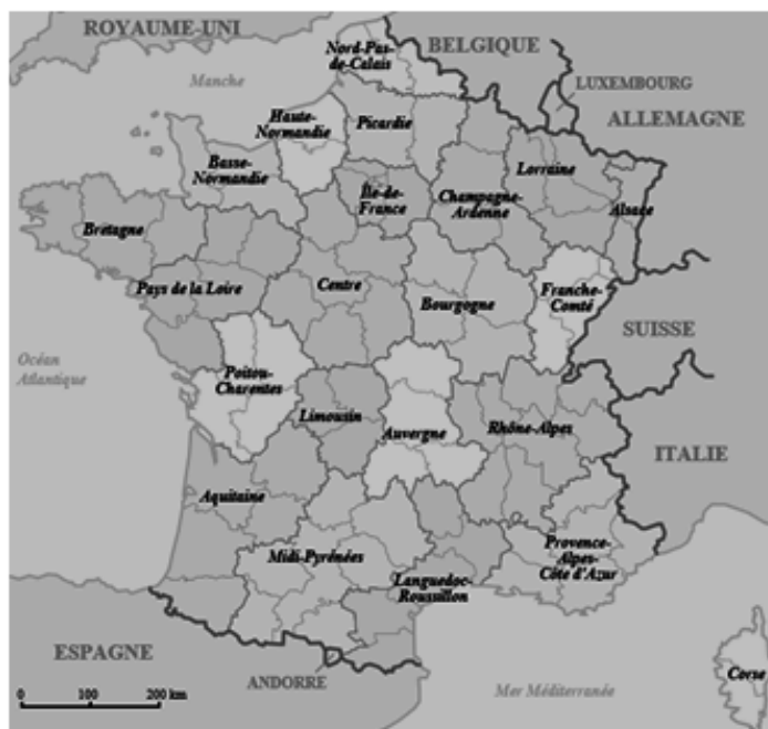
Fig. 4- Carte de régions françaises métropolitaines