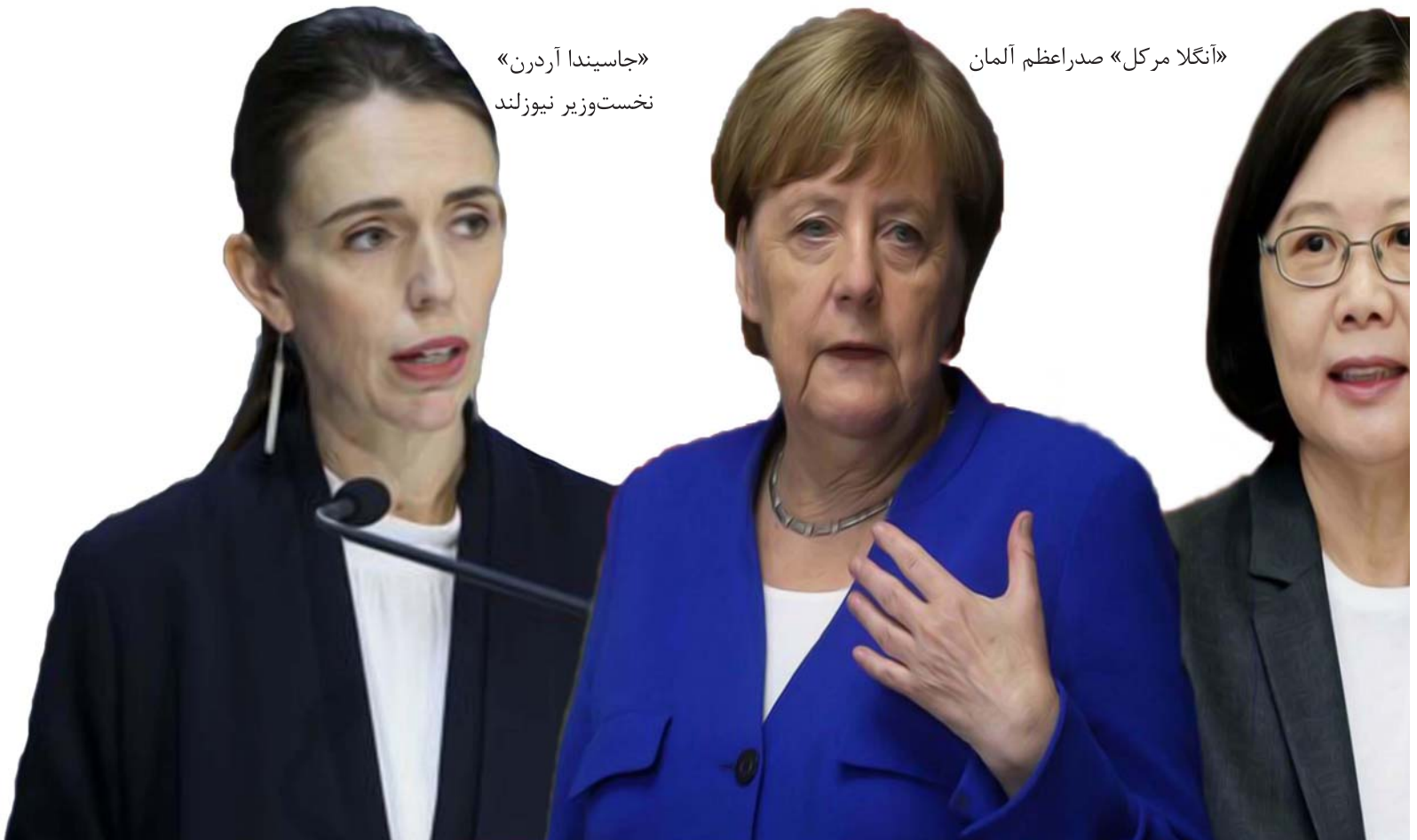
«آنگلا مرکل» صدراعظم آلمان