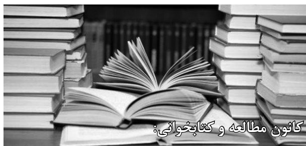
کانون مطالعه و کتابخوانی:

سایت های مرتبط با کانون: www.akkasee.com