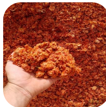
استفاده از تفاله گوجه به عنوان رنگ به جای رنگ مصنوعی

در تفاله گوجه، به ویژه در تفاله پوست گوجه، رنگ قرمز موجود است. راهکاری نیاز است تا بتوان این رنگ را جدا نمود و مجدداً به عنوان رنگ به جای رنگ مصنوعی به رب اضافه نمود. همچنین میتواند به عنوان رنگزای کالای نساجی مورد استفاده قرارگیرد. ایده پردازان محترم لازم است رزومه متنی، رزومه تصویری مرتبط با اینگونه کارهای اجرایی، لیست دستگاه های آزمایشگاهی موجود در دانشگاه که (مورد نیاز و مرتبط با این پروژه است)، زمان حل مساله، قیمت مورد نظر برای حل کامل مساله را ارسال فرمایند.