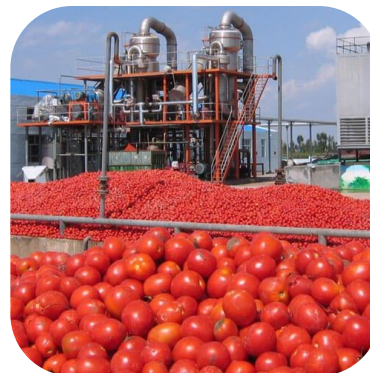
استفاده مجدد از میعان حاصل شده درخت تولید رب گوجه فرنگی

درخت تولید رب گوجه فرنگی در روز حدود ۱۰۰ متر مکعب میعان حاصل میشود. این مایع دارای ذرات و ناخالص است و مد نظر است به جهت صرفه جویی آب در این صنعت، میعان حاصل شده فیلتر شده و بوی آن گرفته شده تا مجددا درخت شستشوی گوجه فرنگی استفاده شود. ایده پردازان محترم لازم است رزومه متنی، رزومه تصویری مرتبط با اینگونه کارهای اجرایی، لیست دستگاه های آزمایشگاهی موجود در دانشگاه که (مورد نیاز و مرتبط با این پروژه است)، زمان حل مساله، قیمت مورد نظر برای حل کامل مساله را ارسال فرمایند.