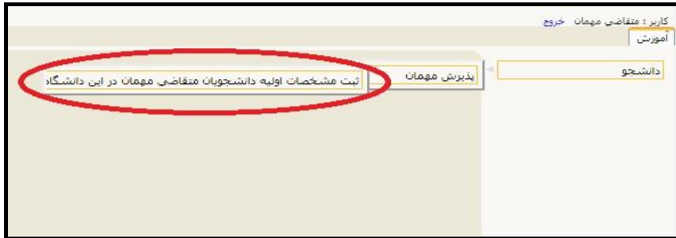
( تصویر شماره ۲ )

در صفحه ثبت مشخصات اولیه دانشجویان متقاضی مهمان در این دانشگاه ، اطلاعات بخش " تعهد نامه متقاضی مهمان " ، " مشخصات اولیه داوطلب " و " شناسه کاربری و گذرواژه مورد نظر " را با دقت تکمیل نموده و همچنین توضیحات مهم در پایین صفحه را با دقت مطالعه نمایید. ( تصویر شماره ۳ ) پس از تکمیل اطلاعات بر روی گزینه " ثبت موقت مشخصات متقاضی " کلیک نمایید. در صورتی که اطلاعات درخواستی را درست تکمیل کرده باشید پیام " اطلاعات با موفقیت ثبت گردید " را ملاحظه خواهید کرد و سیستم به طور اتوماتیک برای متقاضی شماره پرونده صادر خواهد کرد ( تصویر شماره ۴ )، پس از دریافت این پیام جهت تکمیل مراحل از سیستم خارج شوید.