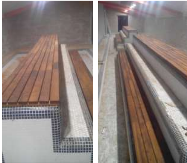
۲۵- گذرگاه چوبی یادمان شهدای گمنام دانشگاه قم، ترموود. (۱۳۹۶)