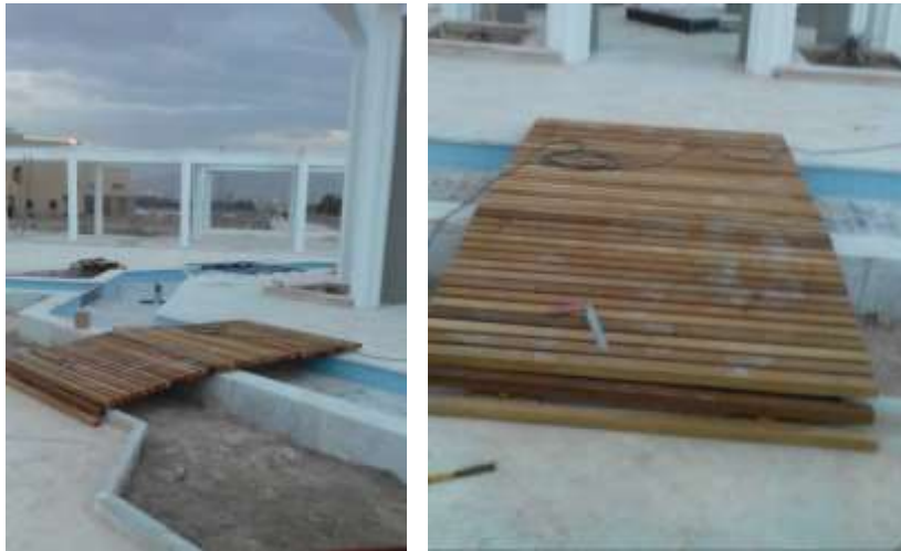
۲۶- پروژه اجرای معرق تمام چوب در ترمینال مرکزی تبریز به طول ۲۵۰ س م در ۱۳۹۷.