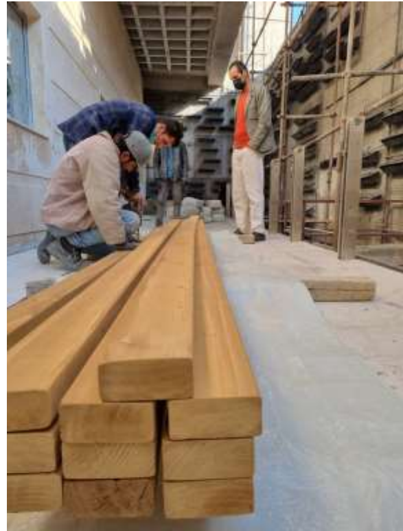
۲۸- اجرای پله چوبی در روستای بلوجه شهرستان کامیاران با چوت ترمو کاج و راش ۱۴۰۲.