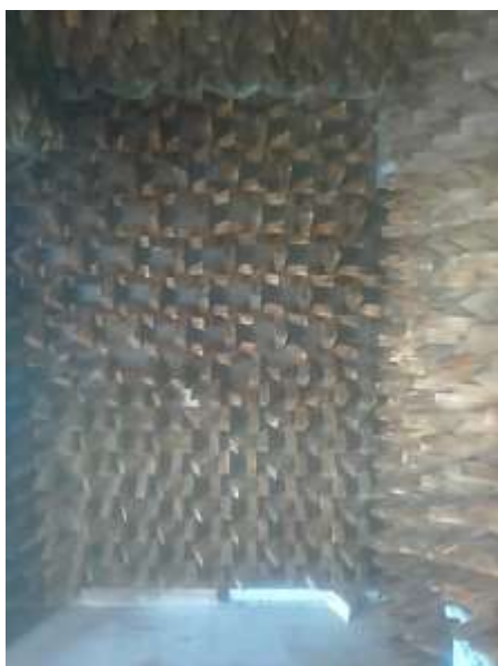
۱۵- اجرای گره چینی ارسی های پنجره تالار گوهریون دانشکده معماری دانشگاه هنر اسلامی تبریز. سال ۱۳۹۷ با چوب گردو.