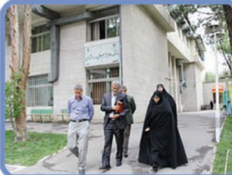
تصاویری از جلسات و بازدید های صورت گرفته در دانشگاه الزهراء(س)